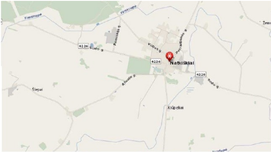
1.pav. Natkiškių gyvenvietės situacijos schema

Rekonstruojami nuotekų valymo įrenginiai yra sklype esančiame greta Timsrupės upės.